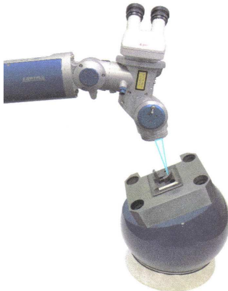
Laserschweißen an der Kontur Fokussierobjektiv 150 mm

Angefangen von der kompetenten Verkaufsberatung zur Auswahl des optimalen Lasersystems folgt weitere Betreuung durch LAWITEX, die nicht nur die Technik, sondern auch die Anwendung umfasst.