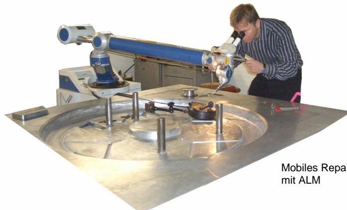
Mobiles Reparaturschweißen mit ALM

Die schweißrelevanten Prozessparameter, die wir nach der Inbetriebnahme kundenspezifisch ermitteln, werden durch Schulungen und Wartungen vom autorisierten Kundendienst stets optimiert – neue Schweißmethoden und aktuelle Schweißzusätze werden vorgeführt.